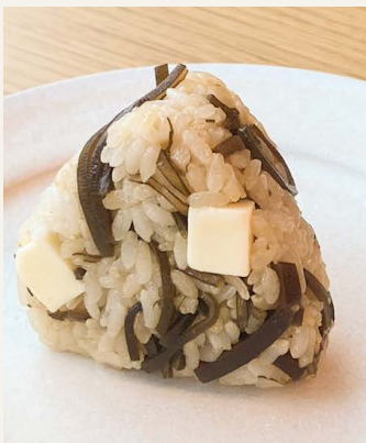
● 気まぐれ昆布 一八〇円