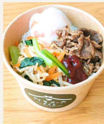
● ビビンバ丼 井 Rice Bowl 六八〇円