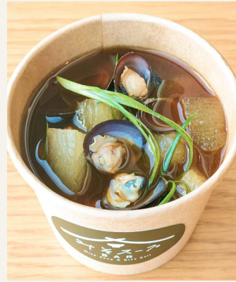
● 赤出汁 (しじみと冬瓜) お味噌汁 Miso Soup 五〇〇円