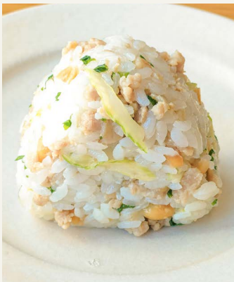
● 鶏ひき肉とセロリの エスニック 二五〇円