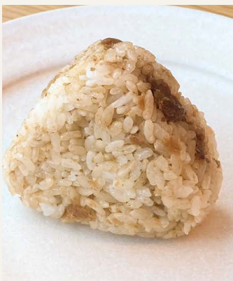
● 気まぐれおかか 一八〇円