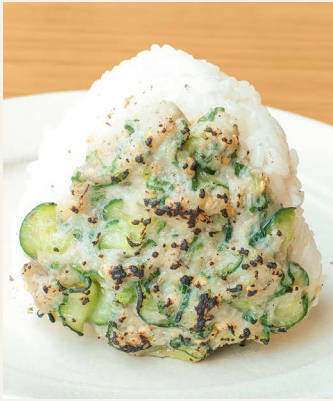
● 冷汁風焼き味噌 おむすび Rice Ball 二五〇円