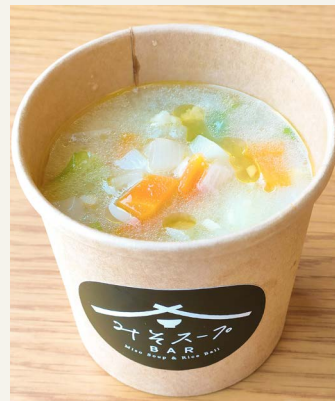
● ミネストローネ 五〇〇円