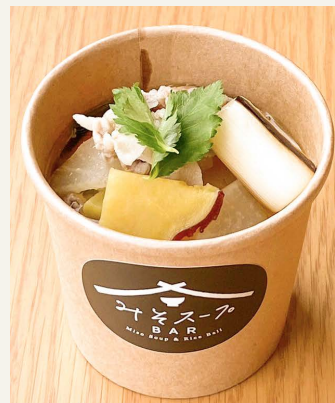
● 豚汁 五〇〇円