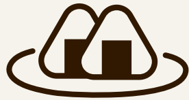
好きなおむすび 2種