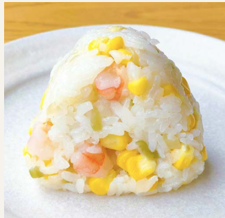
● とうもろこしと海老 二五〇円