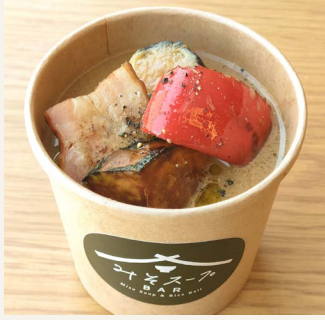
● 赤出汁 (豆乳入り、旬野菜と厚切りベーコン) 五〇〇円