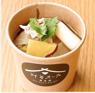
● 豚汁 五〇〇円