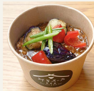
● 麻婆茄子 六八〇円