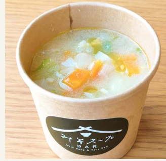
● ミネストローネ (白味噌と野菜) 五〇〇円