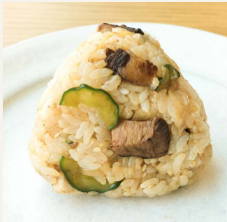
● 手づくり焼豚 (自家製ガリと胡瓜) 二五〇円