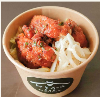
● チキン65 (インド風唐揚げ) 六八〇円