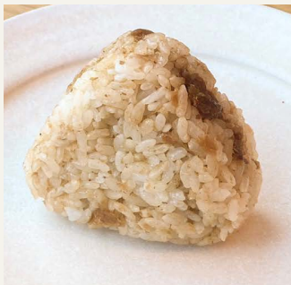
● 気まぐれおかか 一八〇円