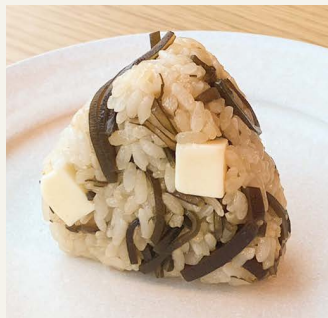
● 気まぐれ昆布 一八〇円