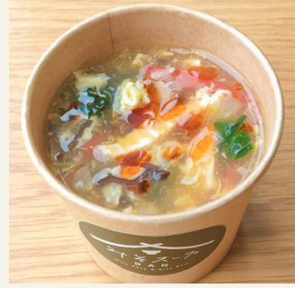
● サンラータン 五〇〇円