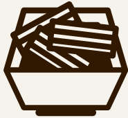
日替わり野菜の小鉢