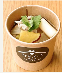
● 季節野菜の豚汁 五〇〇円