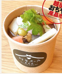
● のっぺ風汁 五〇〇円