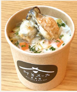
● 牡蠣の和風 クラムチャウダー 五〇〇円