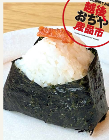
● 柿の種 & かぐら南蛮入り おむすび 二五〇円