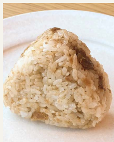
● きまぐれ おかかおむすび 一八〇円