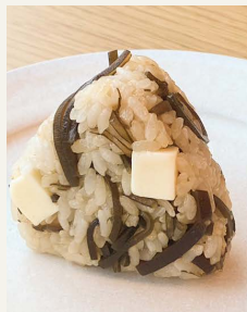
● きまぐれ 昆布おむすび 一八〇円