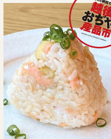
● 鮭とじゃがいもの ちゃんちゃん焼き おむすび 二五〇円