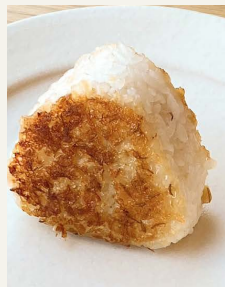
● 焼き味噌 おむすび 一八〇円